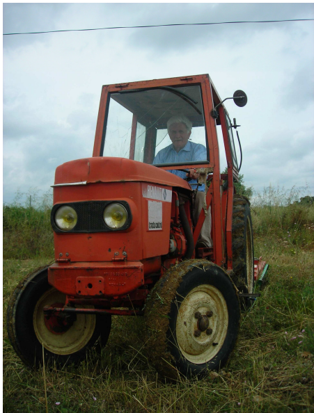
Un tracteur M80 de notre flotte

Pour ses clients le Mas de Vedel lance son FIDELITY PROGRAMM ° :