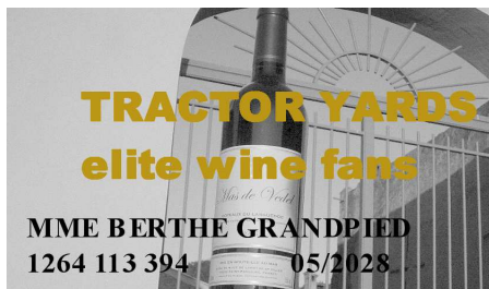
Un spécimen de carte TRACTOR YARDS